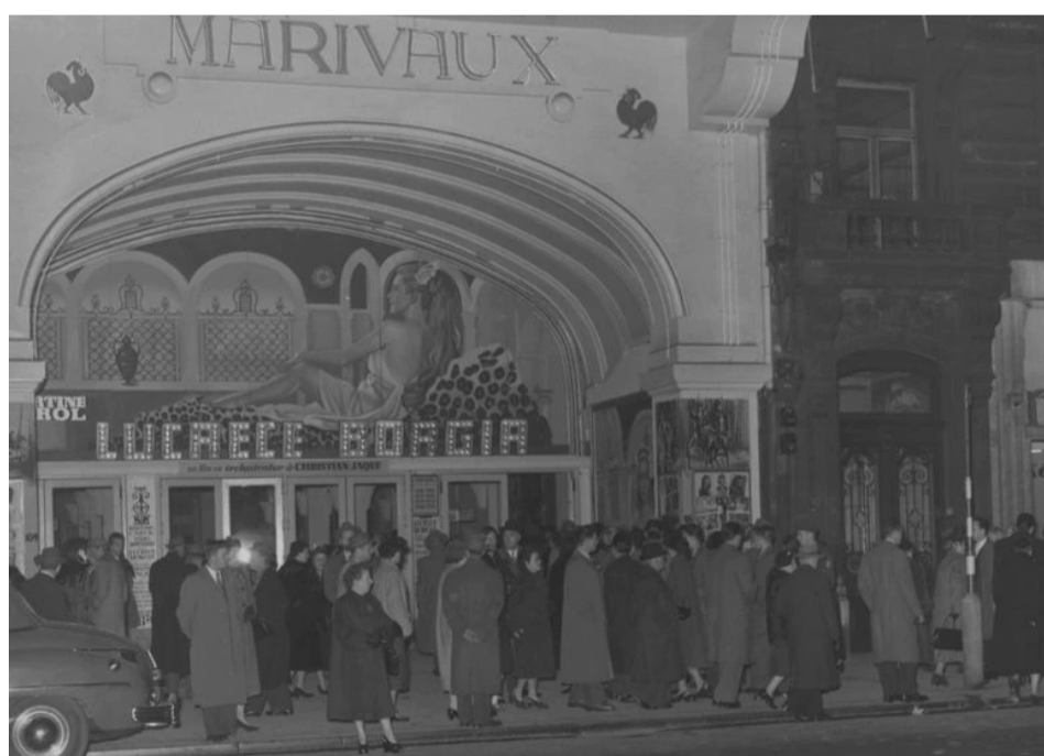
Le cinéma Marivaux vers 1953.